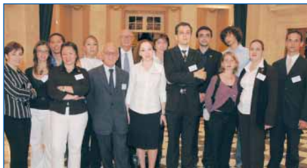
L'équipe 2005 de Carrefours pour l'Emploi à l'École Militaire

Outre la région parisienne, l'association est susceptible d'organiser ses forums partout en métropole comme dans les Départements et Territoires d'Outre-Mer. Incontestablement, les forums organisés clefs en main sont à présent l'atout majeur de l'association. Toujours à l'écoute de ses partenaires et des acteurs de l'emploi, sa constante démarche d'optimisation lui vaut d'être à l'unisson avec la demande des recruteurs et les attentes des demandeurs d'emploi, dans