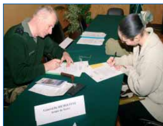
Le Général Emmanuel de Richoufftz lors d'un entretien individuel d'engagement

Fin mars 2006, 105 jeunes étaient encore engagés dans l'opération ; 93 avaient obtenu le code ; 60 avaient déjà décroché leur permis de conduire ; et surtout 2 stagiaires sur 3 étaient salariés !