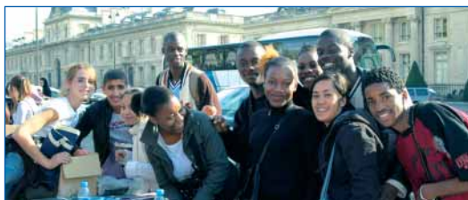
Étudiants bénévoles lors de la constitution des 50 000 kits candidats de Paris pour l'Emploi 2005

Lorsqu'une action est menée, elle est surtout une œuvre collective où l'association joue le rôle d'un catalyseur puissant. Elle fédère les énergies