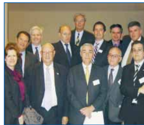
Le conseil d'administration